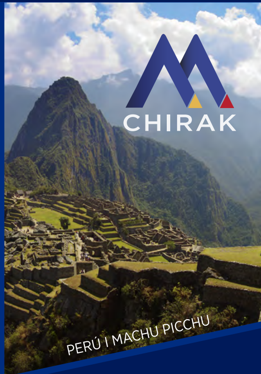
PERÚ | MACHU PICCHU