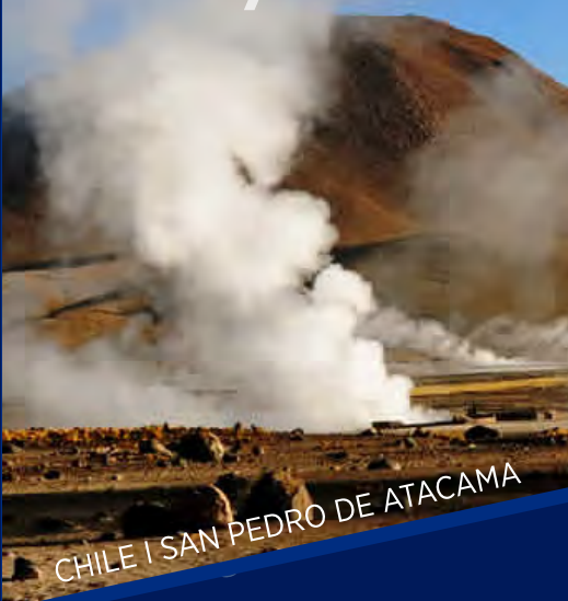
CHILE | SAN PEDRO DE ATACAMA