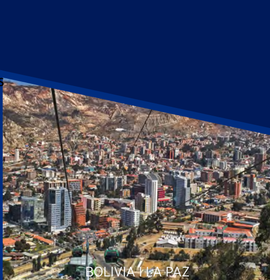
BOLIVIA | LA PAZ

MÁS INFORMACIÓN DE TARIFAS Y HOTELES EN WWW.CHIRAK.CL O WWW.CHIRAK.PE / TARIFARIO / PROGRAMAS COMBINADOS TARIFAS COMISIONABLES / SUJETO A DISPONIBILIDAD