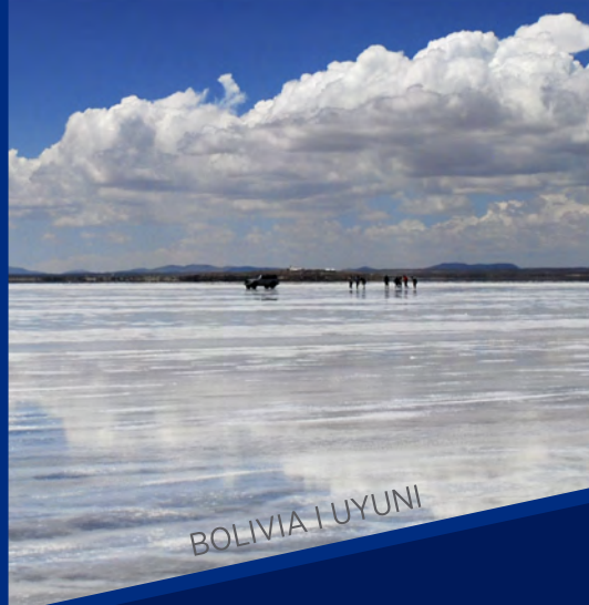
BOLIVIA | UYUNI